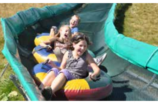
SOMMERTUBING am Hahnenkopf - Kinder ab 5 Jahren!